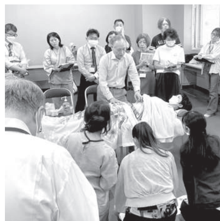
臨床の勉強会の風景

日々のこの臨床において、物事の本質は、何かと意識するというものがあるでしょ。そうした時になぜかなって、なぜこうなのかな、どうしてなのかなって強く意識するわけですよ。そして、今度そのことを確認するための実践作業があるわけだよ。その作業がすごく大事で、実践して確認する。そして、それをまた実践し、確信を得るようにする。この物事の本質は何なのかなと常に意識することが、臨床家としてはすごく必要なのかなと思う。あとは、臨床家として大事なのは感性なんだよね。僕が、学校で教え始めた時には、感性が大事ですよという言葉は禁句の一つだった。今の時代は、世の中変わってきて、捉え方が違って来たね。この感性がすごく大事で、感性を磨くにはどうするかっていうと、直感力なんだよね。