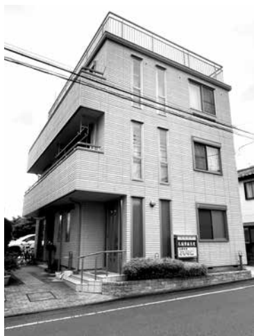
相模原市の孔鍼閣鍼灸院