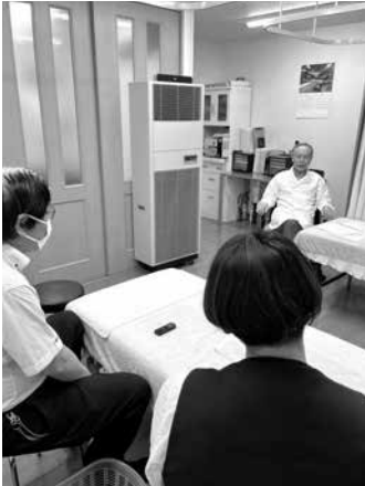
インタビュー風景

本治を行って、数本施術して、症状の痛みを取る。このような治療は、全部、理屈に則っているわけで、それを如何にして、工夫して、引き出して対応するかです。それこそ妙技だね。授業で妙味自在と白板に書いた記憶があるけど、覚えていないかな。